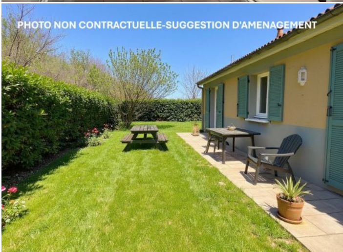
PHOTO NON CONTRACTUELLE-SUGGESTION D'AMENAGEMENT