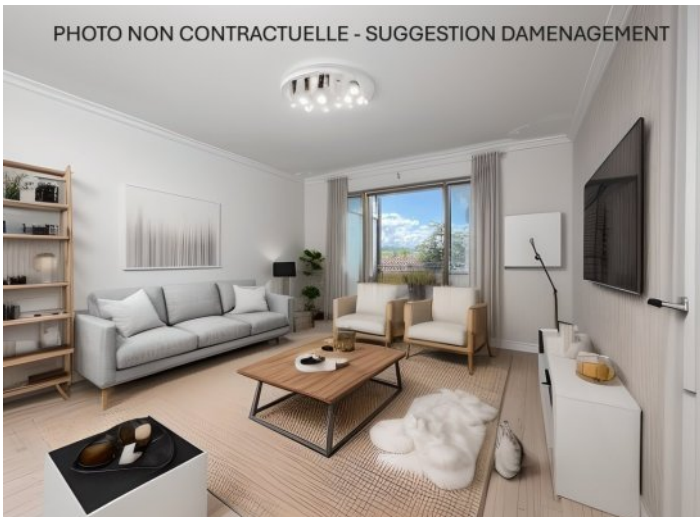
PHOTO NON CONTRACTUELLE - SUGGESTION D'AMENAGEMENT