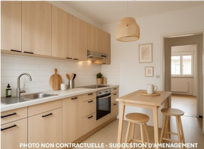
PHOTO NON CONTRACTUELLE - SUGGESTION D'AMENAGEMENT