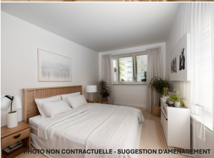
PHOTO NON CONTRACTUELLE - SUGGESTION D'AMENAGEMENT