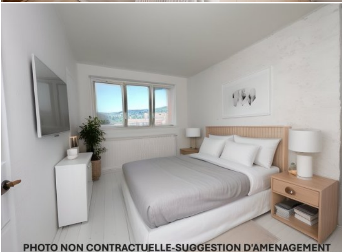
PHOTO NON CONTRACTUELLE-SUGGESTION D'AMENAGEMENT