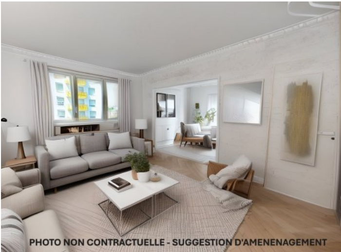
PHOTO NON CONTRACTUELLE - SUGGESTION D'AMENAGEMENT