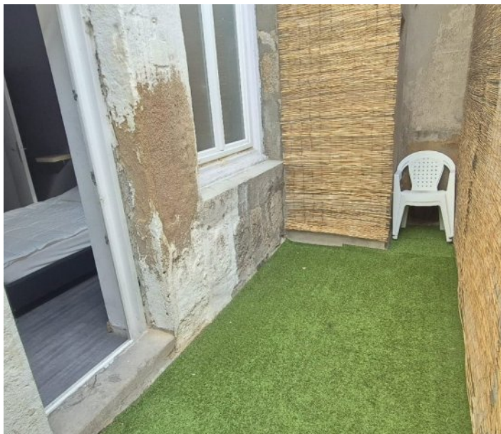
TYPE 2 - 43 m 2 - Chavanelle-Rez de chaussée