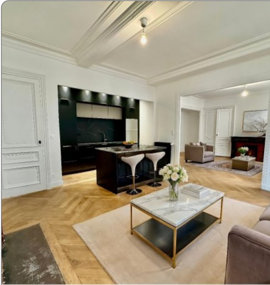
non contractuelle proposée par IACrea

Appartement de standing situé à proximité de la Place Anatole France au dernier étage d'une petite copropriété calme et sécurisé. Ce bien d'une surface de 155m 2 se compose d'une grande pièce à vivre avec une cuisine ouverte équipée et aménagée, 4 chambres pourvu de rangements ainsi que deux salle d'eaux dont une situé dans la chambre parentale. L'appartement à été intégralement refait en 2024 avec des matériaux haut de gamme. Double vitrages, chauffage individuel au gaz. Pour compléter la prestation, des combles de 35m 2 peuvent être aménagées en terrasse tropezienne. Les charges mensuelles sont de 100€ par mois pour 152/860èmes des parties communes générales. Copropriété de 15 lots. Pas de procédure en cours. Pour plus d'informations contactez PIERRE GENTIANE au 06 27 27 18 25 , agent commercial indépendant Les informations sur les risques auxquels ce bien est exposé sont disponibles sur le site Géorisques : www.georisques.gouv.fr